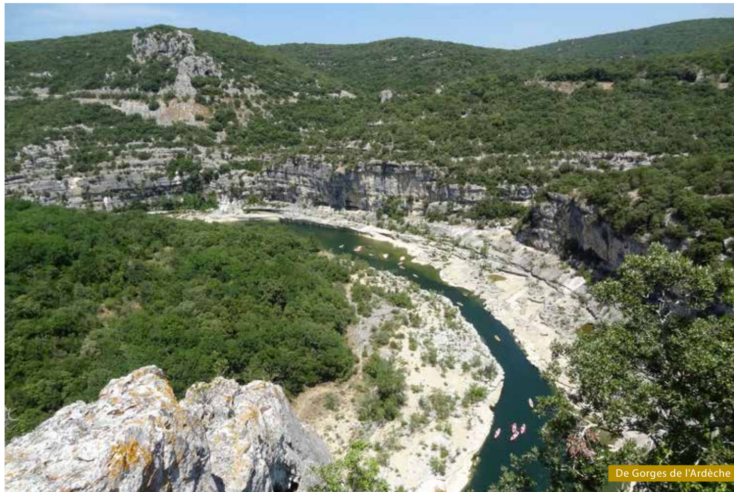
De Gorges de l'Ardèche

Een rondwandeling door de wijngaarden van Domaine de Couron, net ten westen van Saint-Marcel-d'Ardèche, laat mooi de verschillende terroirs van deze zone zien. Het meest kenmerkend zijn de alluviale terrassen met rolkeien die doen denken aan delen van Châteauneuf-du-Pape en heel inhoudsvolle wijnen voortbrengen (vaak Côtes du Rhône Villages). Er zijn ook meer zanderige lössbodems en bodems van kalkmergel, die wat lichtere wijnen geven. Rode wijnen zijn hier hoofdzaak en dat is maar goed ook; ze kunnen zeer goed zijn, zoals die van Domaine du Chapitre en Mas de Libian.