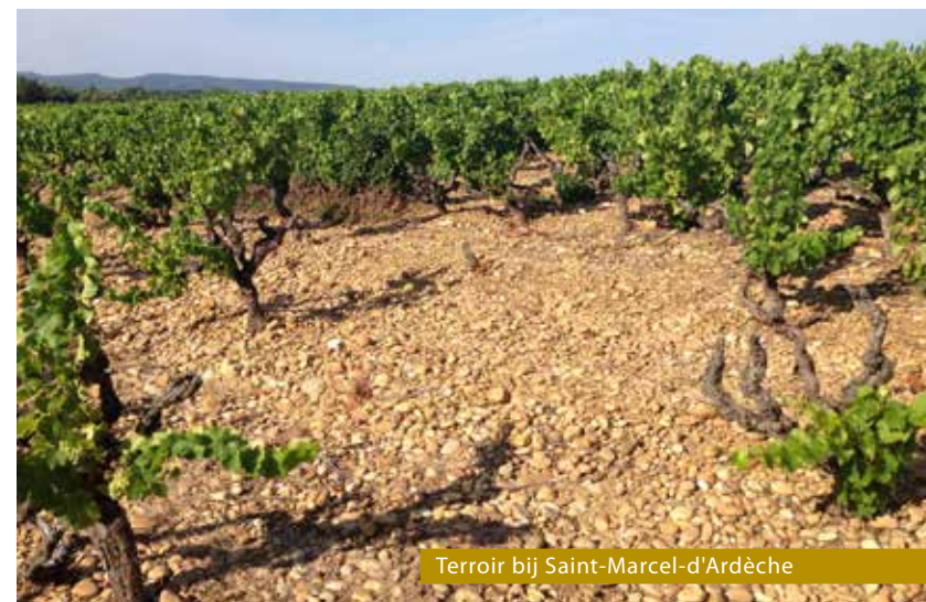
Terroir bij Saint-Marcel-d'Ardèche