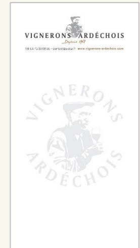
Carnet de commande