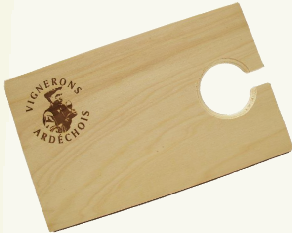
Planche Apéro - Bistro